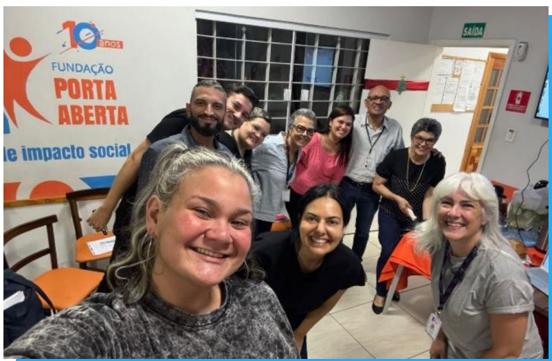
Reunião do Conselho Curador

Para fechar o ano, o Conselho Curador se reuniu no dia 10/12 para definir o planejamento estratégico de 2025 , priorizando iniciativas que ampliem o alcance social e fortaleçam a integração entre projetos.