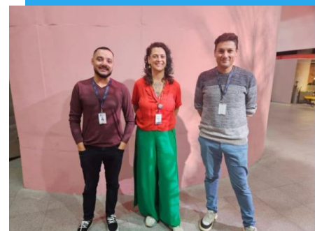
Parceria com Sesc 24 de Maio

Expo Favela Innovation (06/12): Os beneficiários da frente de Sustentabilidade participaram da Expo Favela Innovation, um evento nacional que conecta empreendedores de favelas com investidores, promovendo negócios sustentáveis.