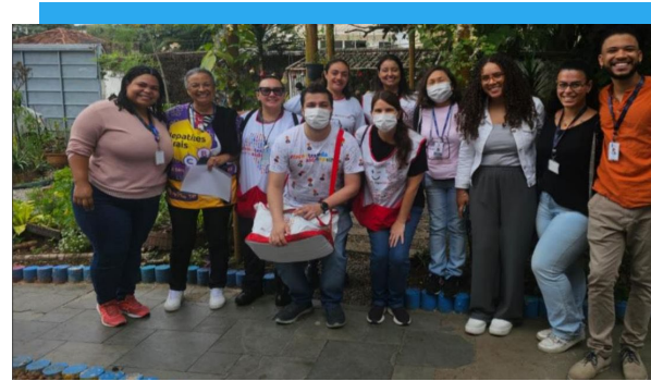
Ações voltadas a saúde e autocuidado

Ceia de Natal (17/12): Momento emocionante com roda de conversa sobre metas para 2025, música, vídeo de retrospectiva e lembrancinhas feitas pelos beneficiários.